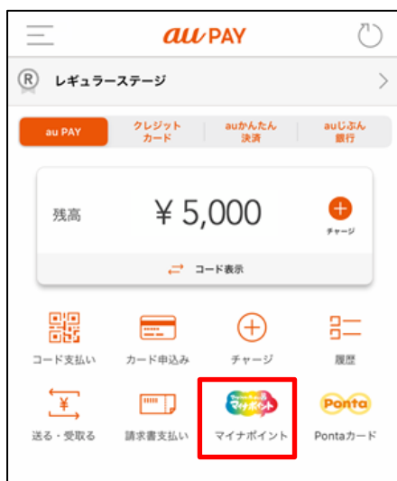
<au PAY アプリ TOP>

au ショップには設定手続き支援端末を設置し、お客さまの手続きをサポートします。